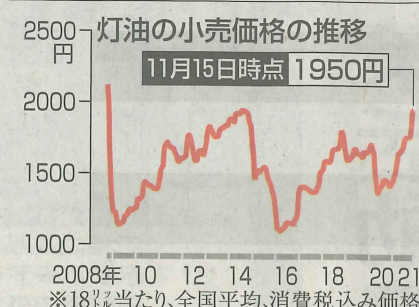
灯油の小売価格の推移 11月15日時点 1950円 ※18ℓ当たり、全国平均、消費税込価格

調査した石油情報センターによると、新型コロナウイルス禍からの経済活動再開が進んで原油需要が高まる中、石油輸出国機構(OPEC)とロシアなど非加盟の産油国でつくったOPECプラスが4日の閣僚級会合で追加増産の見送りを決めたことで需給が逼迫。円安進行で輸入価格が押し上げられたこともあり、灯油とレギュラーガソリンの小売価格が高止まりしている。